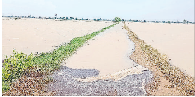
महम उपमंडल में सबसे ज्यादा बरसात होने पर समंदर बने खेत।