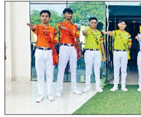
रोहताक। मॉडर्न स्कूल में संपूर्ण हुआ शपथ समारोह