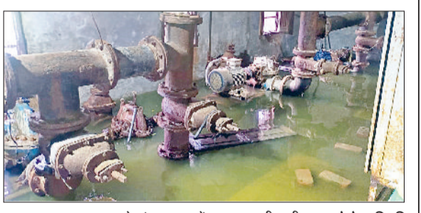
महम। जलघर खरकड़ा के पंप हाऊस में भरा बरसाती पानी।

तालाब का पानी जलघर के वाटर टैंक में पहुंच गया है। वाटर वर्क्स ग्राउंड में भी पानी ही पानी नजर आ रहा है। गांव में गंदे पानी की आपूर्ति की जा रही है। जलघर में तालाब और जलघर का स्तर हुआ समान। गांव में पीने के पानी का संकट बना हुआ है। ग्रामीण जलघर में इकट्ठे हुए और समस्या के समाधान के लिए विचार विमर्श किया। ग्रामीणों ने बताया कि जलघर के साथ लगता तालाब ओवरफ्लो हो चुका है।