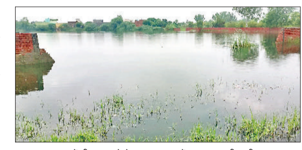
महम। खरकड़ा में दीवार टूटने के बाद जलघर में घुसा बरसाती पानी।