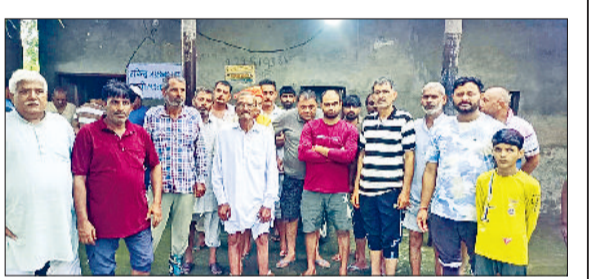
महम। पेयजल समस्या के लिए जलघर में एकजुट खरकड़ा के ग्रामीण।

जिसकी वजह से जलघर व तालाब के बीच बनाई गई दीवार गिर गई और तालाब व जलघर के पानी का स्तर समान हो गया है। ग्रामीणों ने बताया कि जलघर में रखी मोटरों के नीचे भी पानी भरा हुआ है। कभी भी करंट लगने से बड़ा हादसा हो सकता है। वहीं ग्रामीणों ने बताया कि यह समस्या कोई नहीं है बल्कि पिछले दस साल से है लेकिन ग्रामीणों की लगातार मांग के बावजूद कहीं कोई सुनवाई नहीं हो रही है तालाब का गंदा पानी पीने से गांव में बीमारियां फैल रही हैं।